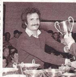
Scarfiotti 1973 - Gianfranco