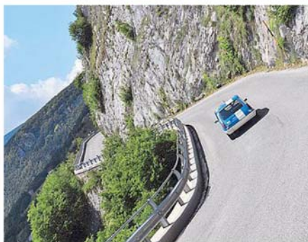
PANORAMA MOZZAFIATO L'appassionante gara ha già conquistato i consensi dei piloti rimasti incantati dal paesaggio