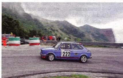
Una gloriosa Fiat 127 nella cronoscalata Sarnano-Sassetto

re e tempi da brivido. Un successo sportivo. Il percorso Sarnano-Sassetto, fin dalla prima edizione 1969, ha incantato i piloti che vi si sono cimentati ed è significativo che era utilizzato proprio dal campione marchigiano Scarfiotti per allenarsi in vista delle sfide in salita che l'hanno incoronato due volte campione europeo negli anni sessanta. L'albo d'oro sarnanese: nove successi del "toscanaccio" Mauro Nesti, quattro edizioni di campionato europeo, tre vincitori stranieri come Reish,