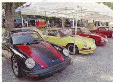
FLASH Un momento delle verifiche. Sotto alcune delle automobili che oggi pomeriggio si sfideranno alla Sarnano-Sassotetto