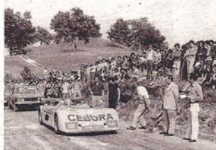
Scarfiotti 1973 - Folla incredibile alla partenza di un prototipo Lola Cebara